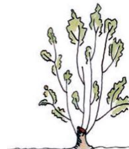
2 Jaar na afzet