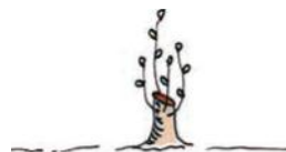
1 Jaar na afzet